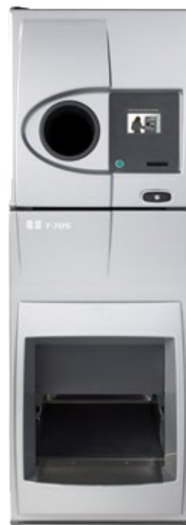
Reverse Vending Tomra

La taglierina rimane efficiente per più di 1.000.000 di tagli, mentre la testina di stampa garantisce una durata pari a 200 Km. Completano il dispositivo una temperatura operativa in esterno che va dai -20° ai +70° e una velocità di stampa superiore ai 1.000 mm/s. Un insieme di caratteristiche e funzionalità che si possono riassumere in pochi, semplici concetti: affidabilità, efficienza e lunga durata .